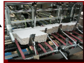
MACCHINA PIEGA INCOLLA