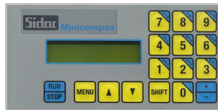
MINICOMPAX MC 211/ C